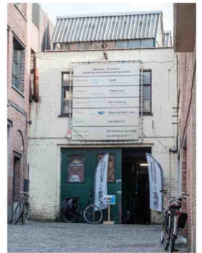
De voormalige wasserij staat al sinds 1996 leeg.

"We hebben de gebouwen voor een symbolische euro aangekocht."