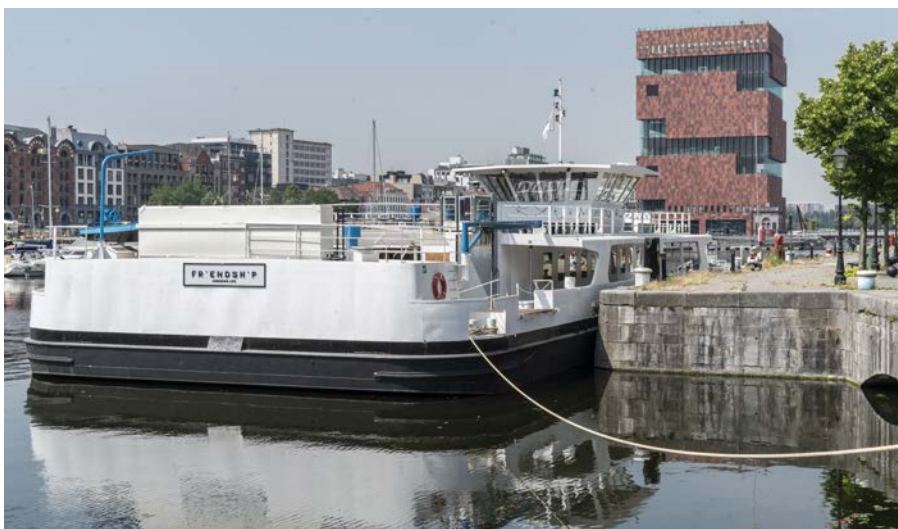
De achterkant van de kantoorboot met bovenop het dek een stalen bak met het beluchte rietveld; op de achtergrond het MAS (Museum Aan de Stroom) in Antwerpen.

Het concept van een belucht rietveld had zijn waarde reeds bewezen op de badboot. WeGroSan/hmvt ging echter nog een stap verder door een gedeelte van het gezuiverde water te recupereren. Het effluent van het rietveld op de boeg wordt geloosd op het dok. Het effluent van het rietveld op de achtersteven wordt opgevangen in de zes watertanks voor de toiletten. Na bewerking door het actiefkool-filter is dit water geschikt voor het spoelen van de toiletten. De wasbakken en de keuken blijven aangesloten op het leidingwater dat periodiek vanaf de wal wordt aangeleverd. Op deze manier wordt het grootste deel van het afvalwater gezuiverd en via de toiletten hergebruikt; de rest wordt geloosd. Dit resulteert in een aanzienlijke besparing van leidingwater.