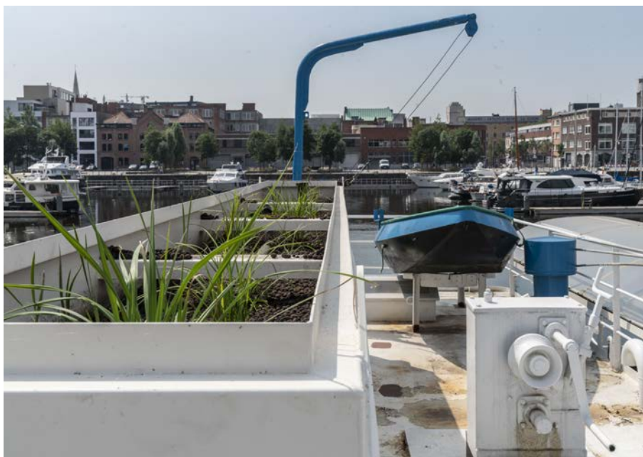
Bak met belucht rietveld op de achtersteven. Water uit deze bak komt in de tanks. De bak op de voorzijde loost op de haven.

Het afvalwaterrecuperatiesysteem op de kantoorboot werd dit jaar in gebruik genomen. Uit de eerste bemonsteringen blijkt dat het geloosde effluent ruimschoots onder de toegestane normen zit. Het biologisch zuurstofverbruik (BZV) ligt met < 3 \text{ mg/l} ver onder de norm van 25 \text{ mg/l} . En hetzelfde geldt voor het Chemisch Zuurstof Verbruik (CZV) van 59 \text{ mg/l} (norm: 125 \text{ mg/l} ) en de zwevende stoffen 13 \text{ mg/l} waar 60 \text{ mg/l} de norm is. Het beluchte rietveld toont hiermee aan een zeer effectief systeem te zijn voor de zuivering van afvalwater. In combinatie met actiefkoolfiltratie, waarmee gezuiverd water hergebruikt kan worden voor laagwaardige toepassingen, is deze optie interessant op plekken waar geen waterleiding aanwezig is, waar strenge normen moeten worden behaald en waar weinig ruimte is. Eén nadeel is er (nog) wel: de relatief lange terugverdientijd van deze investering. Maar zolang groen, slim en een hoog zuiveringsrendement doorslaggevend is in de afweging, blijkt het beluchte rietveld in alle opzichten de meest logische keuze.